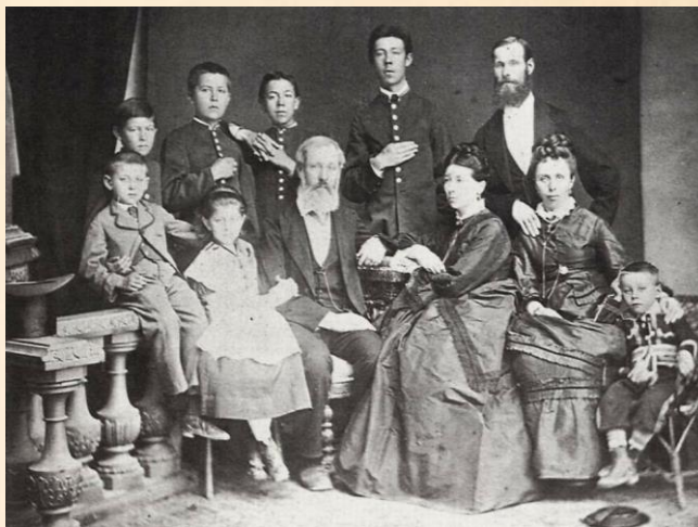
Семья Чеховых. Таганрог, 1874 А. П. Чехов стоит второй с лева

20. Всю жизнь занимался благотворительностью. Например, в Мелихове, где купил себе имение, Чехов организовал врачебный пункт, в котором каждый день, начиная с пяти часов утра, принимал больных и снабжал их лекарствами. В 1892 году во время эпидемии холеры писатель работал санитарным врачом от земства. Но одной только врачебной деятельностью Антон Павлович не ограничивался. Он собирал средства для нуждающихся, строил школы. Не бросил благотворительность Чехов и после переезда в Ялту, несмотря на то, что уже сам был тяжело болен.